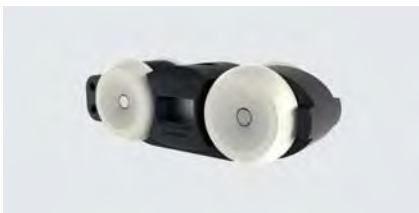
Laufwagen RX100A, 2 Stück

Optimierter Beschlag mit minimierter Aufbauhöhe für Holztüren. Neu mit eloxierten Bauteilen und integrierter Höhenverstellung zur leichteren Montage.