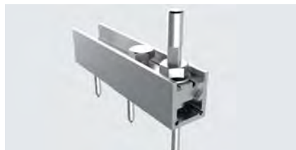
MX Tragflansch 202083A-45NEO, 2 Stück