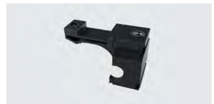
Haltestopper SX 100H, 2 Stück