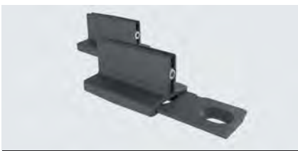
Bodenführung T-Guide Holz