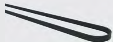
Zahnriemen 05M, 10 m