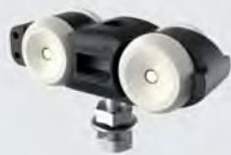
Laufwagen RX100A, 4 Stück

Wartungs- und verschleißfreies Schiebetürsystem in kompakter Bauweise. Durch die optimierten Bauteile ermöglicht es der Synchron-Beschlag, mit einfachem Montageaufwand große Durchgangsbreiten schnell und ansprechend zu öffnen und zu schließen.