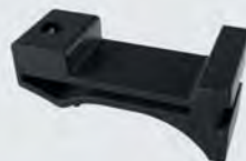
Haltefeder SX-H, 2 Stück