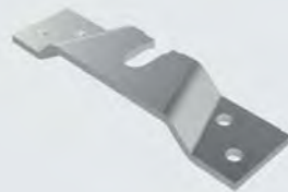
Tragflansch 8069, 4 Stück