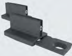
Bodenführung T-Guide Holz