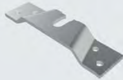
Tragflansch 8069, 2 Stück