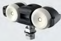
Laufwagen RX100A, 2 Stück